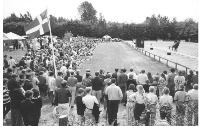
DM dressur 1995 – fulde huse på tilskuerpladserne